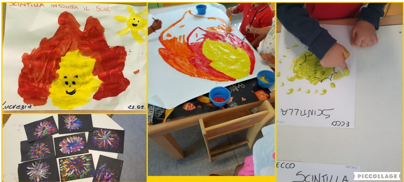
Scintilla e i Fuochi d'artificio