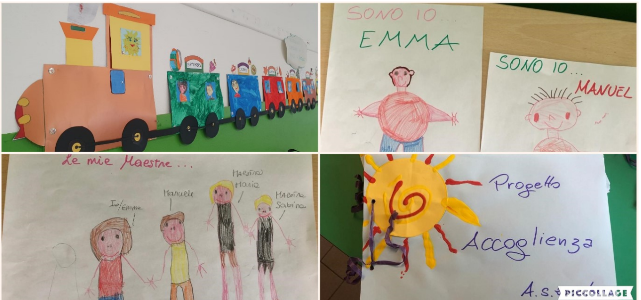
Le nostre maestre, i compleanni.....