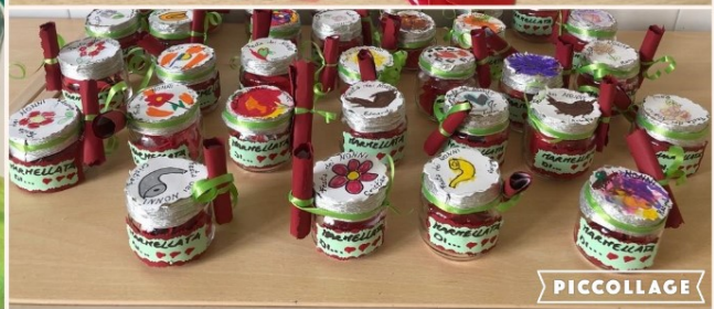
Festa dei Nonni 2 ottobre 2022!